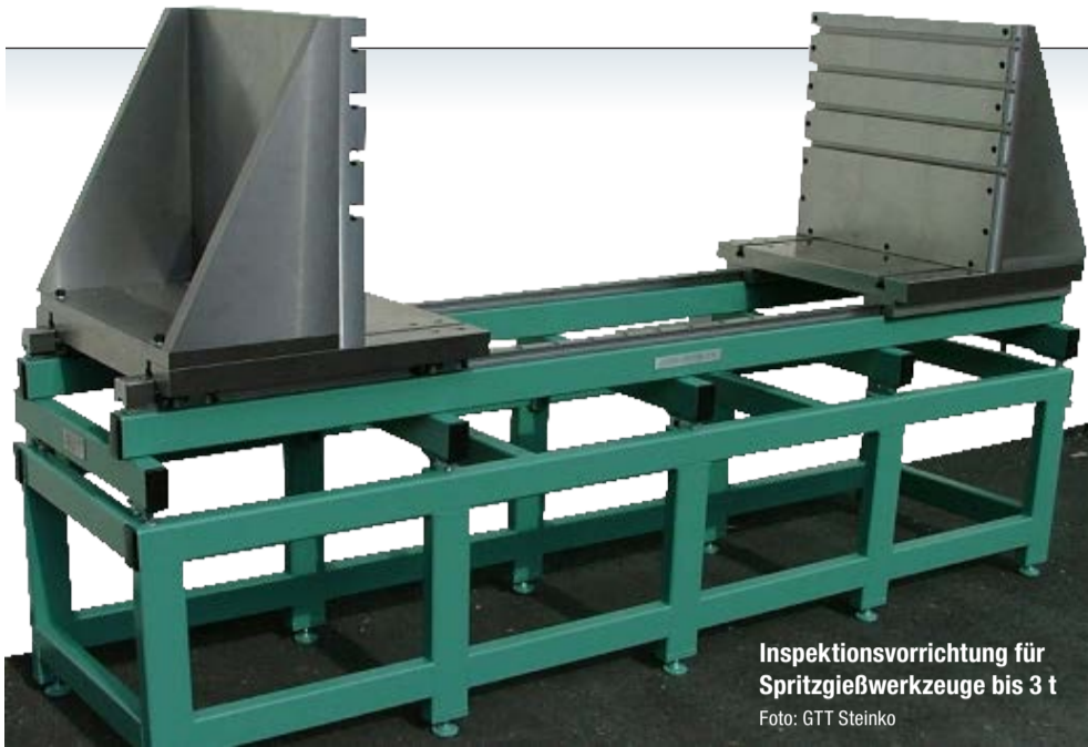
Inspektionsvorrichtung für Spritzgießwerkzeuge bis 3 t