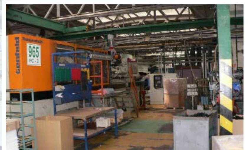
Wie Wunsch und Wirklichkeit: Ordnung und Übersicht am Materialbahnhof bei Zentralversorgung und die andere Realität bei vielen Verarbeitern, mit eng gestellten Maschinen, offenen Oktabins – ein logistisch sinnvoller Materialfluss ist nicht zu erkennen